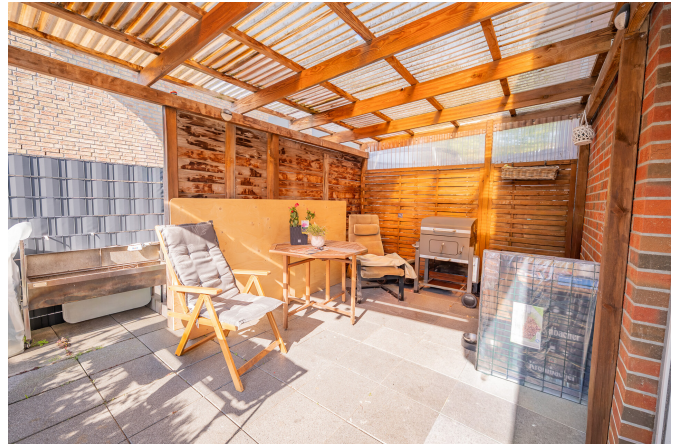
Reihenhaus Links - Terrasse