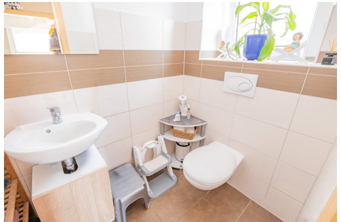
Reihenhaus Links - Gäste-WC