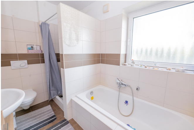
Reihenhaus Links - Badezimmer OG