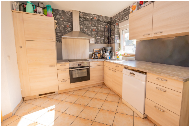
Reihenhaus Links - Küche