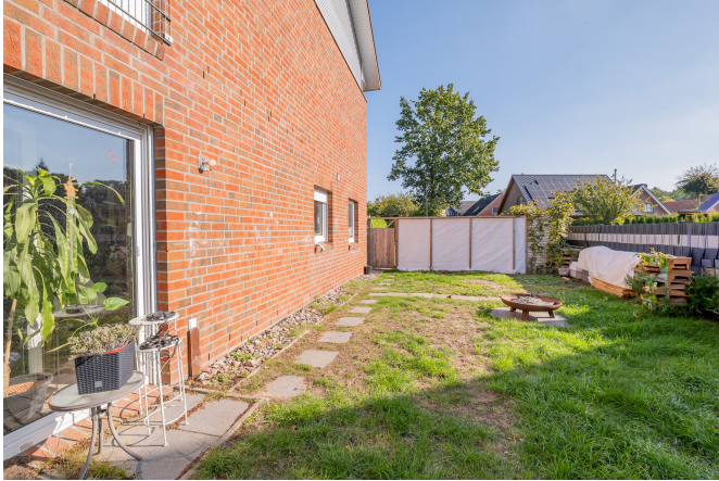
Reihenhaus Links - Garten